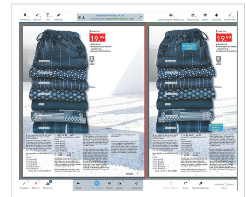
Proofing und Freigabe in Dalim