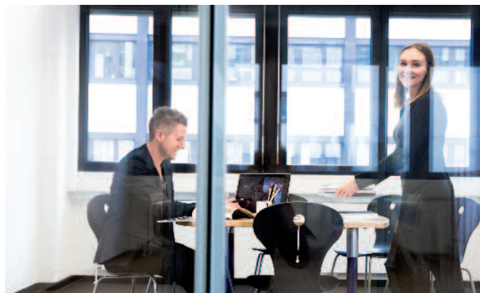
Doch trotz aller Technik: Ohne Menschen und eine vertrauensvolle Kundenberatung geht auch in dem automatisiertesten Business nichts.

nen Technologie-Umfeld unterwegs. Deshalb verbinden wir die unterschiedlichsten Technologien zu einem sinnvollen Großen und Ganzen«, konstatiert Schneider.