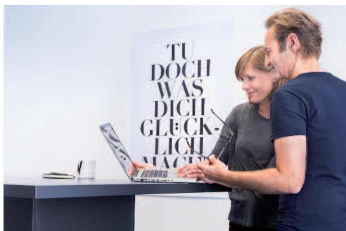
Rund 100 Mitarbeiter arbeiten in München bei w&co für Kunden aus Industrie, Handel und Verlagen.

Damit schloss sich der Kreis: w&co war wieder beim Bild und bildgebenden Arbeiten, angelangt. Allerdings ist von Scannern & Co., die einstmals zum Kerngeschäft gehörten, heute weit und breit nichts mehr zu sehen. Stattdessen Rechner und Monitore so weit das Auge reicht. Das schon