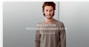
Grafik für Slider