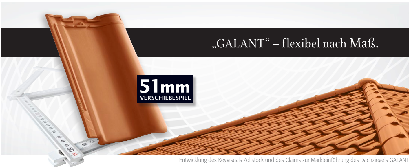
Entwicklung des Keyvisuals Zollstock und des Claims zur Markteinführung des Dachziegels GALANT

Die CREATON AG aus Wertingen bei Augsburg ist einer der erfolgreichsten Dachziegelhersteller Europas. CREATON als eines der marktführenden Unternehmen im Bereich der Biberschwanz- und Pressdachziegel kann auf eine 130jährige erfolgreiche Unternehmensgeschichte zurückblicken.